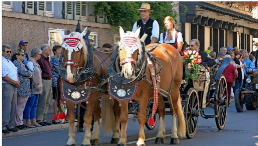
Der Brauchtumsumzug am Sonntagmittag war auch in diesem Jahr wieder der Höhepunkt des Herbstausklanges in Ihringen.